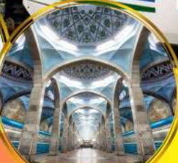
รถไฟฟ้าใต้ดิน