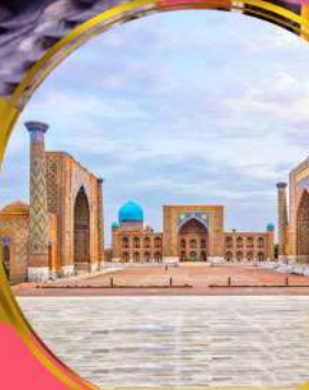
จัตุรัสเรอิสตัน