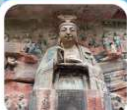
"ผาหินแกะสลักต้าจู้"