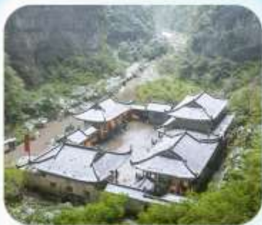
อุทยานหลุมฟ้าสะพานสวรรค์

บินตรงลงชิง • อยู่หลง หลุมฟ้าสะพานสวรรค์ • ระเบียบแก้ว • อุทยานเขานางฟ้า หงหยาดัง • นั่งรถไฟกะสุติก • ส่องเรือชมดวงชิงยามค่ำคืน • ศาลาประชาคม มรดกโลกผาหินแกะสลักต้าจู้ • เมืองโบราณซือปาเก้ • วัดหลิวอัน • ดึกตะเทียบ