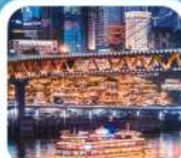
ส่องเรือชมวิวหงหยาดัง