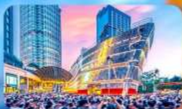
เรือทลุยส์วิตตอง