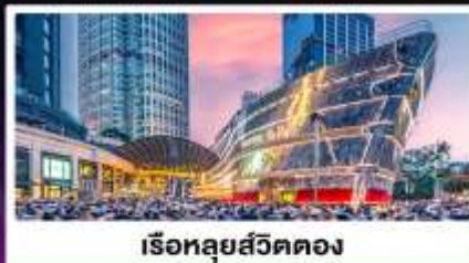
เรือหลุยส์วิตตอง