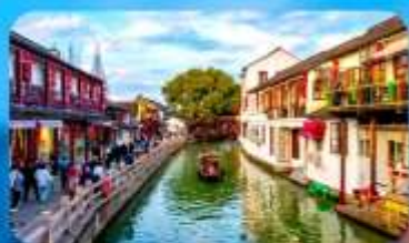
เมืองโบราณจูเจียเจี้ยว

HOLIDAY INN EXPRESS HOTEL หรือเทียบเท่า 4 คาว