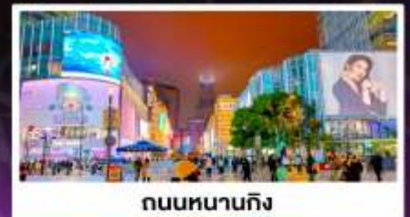
ถนนหนานกิง