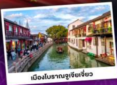
เมืองโบราณซูเจียเจี้ยว