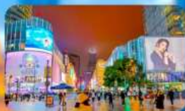
ถนนหนานกิง