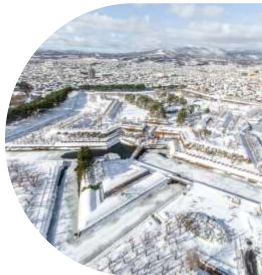
ที่ดูคลาสสิกที่แม่

จากนั้นนำท่านชม สวนสาธารณะโกเรียวกาคู ที่ได้รับเลือกให้เป็นแหล่งประวัติศาสตร์แห่งชาติ ปัจจุบันเป็นสวนสาธารณะที่โอบล้อมด้วยธรรมชาติ ท่านสามารถเพลิดเพลินไปกับการเดินชมทัศนียภาพอันสวยงามได้ตลอด สี่ฤดู: ชมซากุระบานในฤดูใบไม้ผลิ, พฤษภษาเขียวขจีในฤดูร้อน, ไม้ผลัดใบในฤดูใบไม้ร่วง และหิมะในฤดูหนาว ชั้นจุดชมวิวที่ติดกับหอคอยโกเรียวกาคูเป็นจุดชมวิวมุมกว้างขวางที่สามารถมองเห็นป้อมปราการรูปดาวขนาดมหึมา ( สะพานข้ามเข้าไปในพื้นที่รูปดาวเปิด 09.00-19.00 ไม่รวมค่าขึ้นหอคอยมีค่าใช้จ่ายเพิ่มท่านละ 900 เยน )