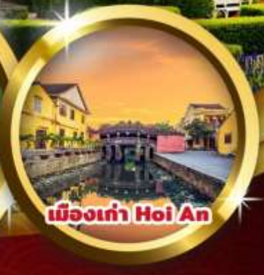
เมืองเก่า Hoi An