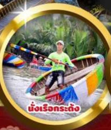
นั่งเรือกระดิ่ง