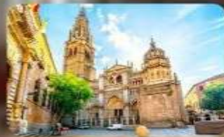
มหาวิทยาลัยโตเลโด