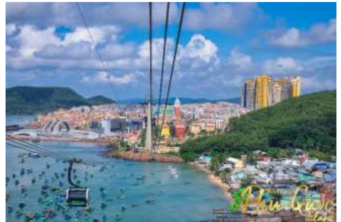
Sun World Hon Thom Nature Park พบกับ

เดียวของเวียดนาม (สำหรับท่านที่สนใจเล่นสวนน้ำ กรุณาเตรียมชุดสำหรับเล่นน้ำ 1 ชุด)