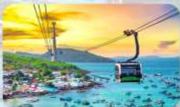
Hon Thom Island