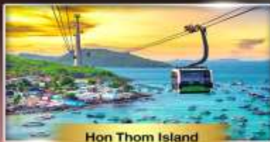
Hon Thom Island