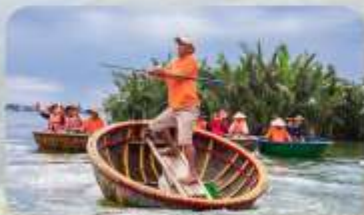
นั่งเรือกระด้ง

Mercury Bana Hill French Village บานาฮิลล์