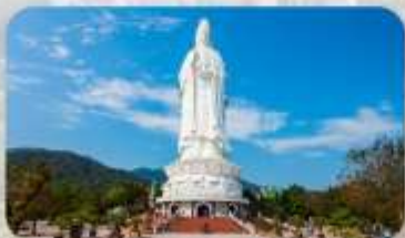
วัดลินห์อิ่ง