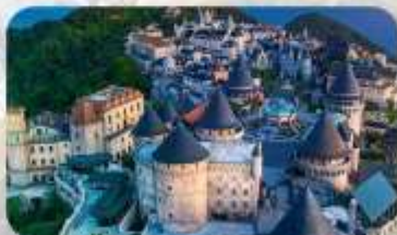
Ba Na Hills