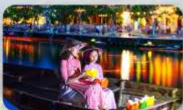
ล่องเรือลอยกระทง

MAGNOLIA ที่จัดขึ้นที่ท่ามาตุลาฮานเวียดนาน