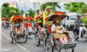
นั่งรถฮิโคลในเมืองดานัง