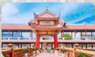
วัดนามเชิน