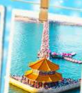
ซาโจโป่ว