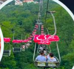
ขึ้นกระเช้า ภูเขาไท่ผิง