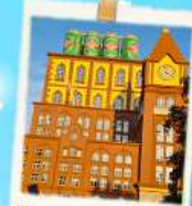
โรงแรมเบียร์