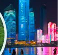
หาด No.3 Bathing Beach