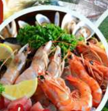
อิ่มอร่อยกับ เมนูซีฟู้ด