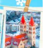
โบสถ์ซิงเต่า