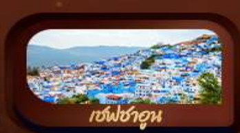
เชฟชาอูน