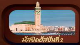
มัสยิดฮัสซันที่ 2