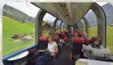
สระพมเวียดนาม