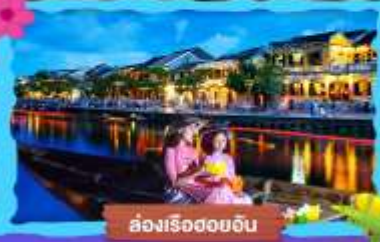
ส่องเรือฮอยอัน