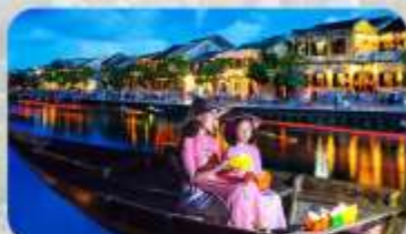
ล่องเรือฮอยอัน