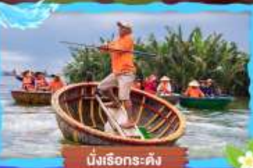
นั่งเรือกระด้ง