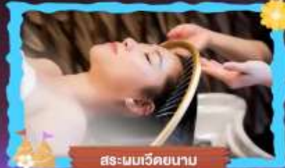
สระนมหเวียดนาม