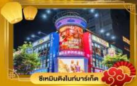
ช้อปปิ้งไนท์มาร์เก็ต