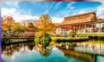
โอชิโนะ ฮักโค