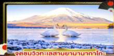
จุดชมวิวกะเลสาบยามานากาโกะ