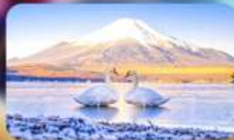
จุดชมวิวกะเลสาบยามานากาโกะ