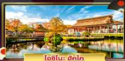
ไอชิโนะ ฮิโตะ