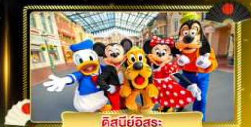
ดิสนีย์อิสระ