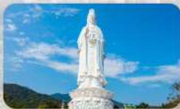
วัดลินห์อิ่ง