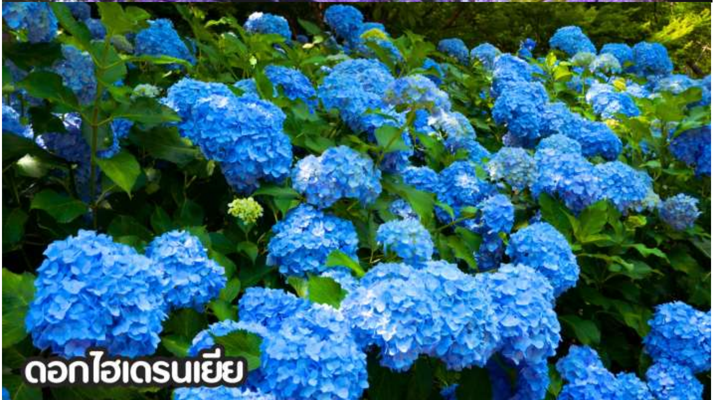
ดอกไฮเดรนเยีย

**หมายเหตุ: โปรแกรมชมดอกไม้ช่วงเดือน พ.ค. - ต.ค.2569 ในช่วง ณ วันเดินทางดังกล่าว หากดอกไม้ยังไม่บานหรืออาจจะร่วงหล่น..ทั้งนี้ขึ้นอยู่กับสภาพอากาศของแต่ละปี ทางบริษัทไม่ประกันติ และไม่สามารถกำหนดการบานของดอกไม้ได้ ทางบริษัทฯ ขอสงวนสิทธิ์ปรับเปลี่ยนรายการท่องเที่ยวอื่นทดแทนนะคะ รบกวนท่านโปรดทราบและทำความเข้าใจค่ะ**