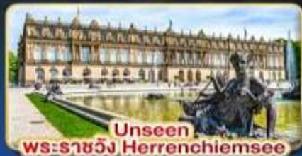
Unseen พระราชวัง Herrenchiemsee

📅เดินทาง : 3-10 เม.ย. | 7-14 เม.ย. 30 เม.ย. - 7 พ.ค. 69