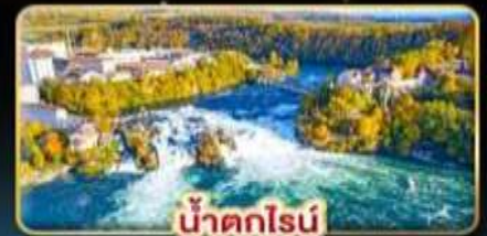
น้ำตกไรน์