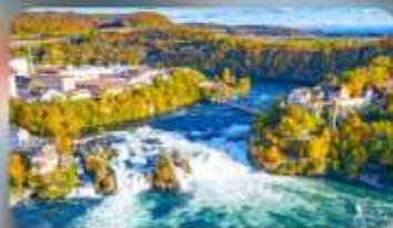
น้ำตกโรน