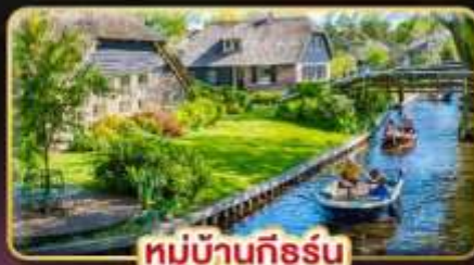
หมู่บ้านทึร์รัม