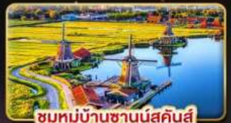
ชมหมู่บ้านชาวนันส์คินส์