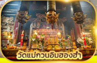
วัดแม่กวนอิมสองข่า