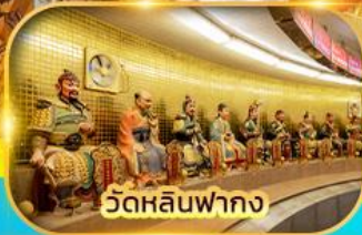
วัดหลินฟาถง