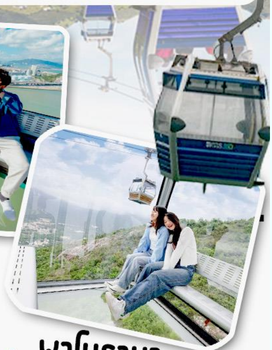
พานิราม่า