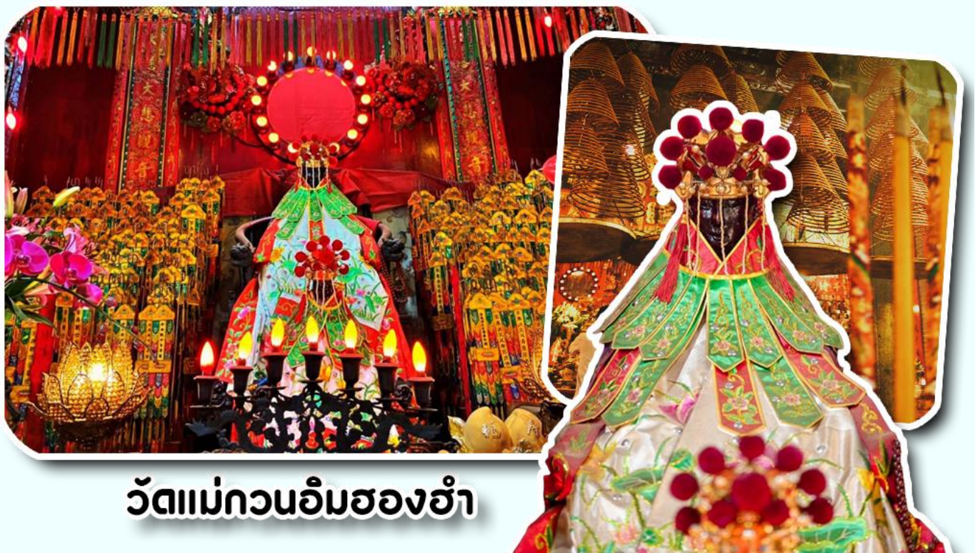
วัดแม่กวนอิมสองฮ้า

จากนั้นพาท่านเข้าไปไหว้ขอพร วัดแม่กวนอิมสองฮ้า วัดเก่าแก่ของฮ่องกงสร้างตั้งแต่ปี ค.ศ .1873 เป็นวัดขนาดเล็กที่มีชาวฮ่องกงศรัทธา นับถือกันเป็นอย่างมากวัดแห่งนี้เป็นที่ประดิษฐาน องค์เจ้าแม่กวนอิมสองฮ้า ที่มีชื่อเสียงเรื่องการให้กู้ยืมเงินเชื่อกันว่าท่านช่วยพลิกฟื้นเศรษฐกิจของชาวฮ่องกง ผู้คนจึงนิยมมาเยี่ยมเงินทำธุรกิจจนสำเร็จ ร่ำรวย รุ่งเรืองโดยให้ท่านอธิษฐานขอพรต่อหน้า เจ้าแม่กวนอิมสองฮ้าพร้อมกับระบุวันเวลาในการขอพรด้วย จากนั้นนำธูปธูปตามฐานะและศรัทธาที่เราจะนำเป็นสื่อในการขอพร เขียนจำนวนเงินที่ต้องการลงไปด้วย ใส่สกุลเงินยิ่งดีใหญ่ แล้วนำเงินใส่ในซองแดง ควรเตรียมซองแดงไปเอง นำซองแดงไปวนรอบกระถางธูป วนขวาจำนวน 3 ครั้ง แล้วเก็บซองแดงในกระเป๋าสตางค์ เป็นเงินขวัญถุง ถ้าประสบความสำเร็จตามที่มุ่งหวัง ให้นำเงินในซองแดงทำบุญหยอดตู้ที่วัดแห่งนี้ในโอกาสต่อไป