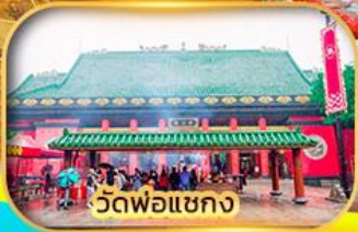
วัดพ่อแชกง