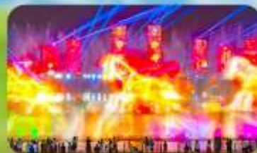
น้ำพุคนตรีคังปาสือ