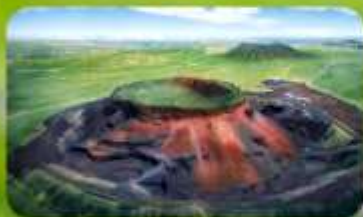
ภูเขาไฟอูลันคา