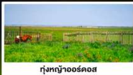
ทุ่งหญ้าออร์ดอส