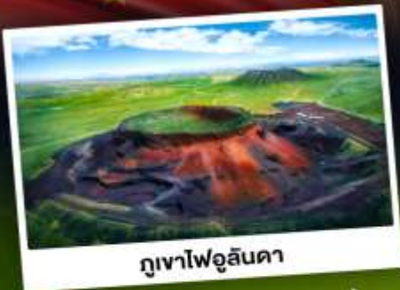
ภูเขาไฟอูลันดา

ท่องเที่ยวแดนแห่งทะเลทรายและทุ่งหญ้า ชมพระอาทิตย์ขึ้นทุ่งหญ้าออร์ดอส