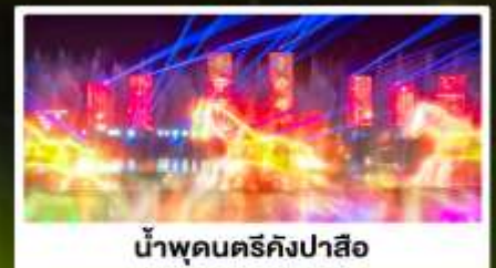
น้ำพุดนตรีคังปาสือ