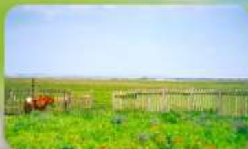
ทุ่งหญ้าออร์คอส