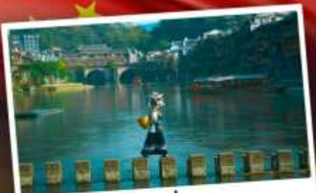
หมู่บ้านเฟิ่งทง

สุดคุ้ม!! พัก 5 ดาว ทุกคืน มนตร์เสน่ห์เมืองเก่า ริมสาងน้ำแห่งจินเจี้ยน