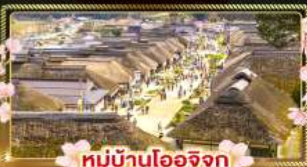
หมู่บ้านโออิจิคุ