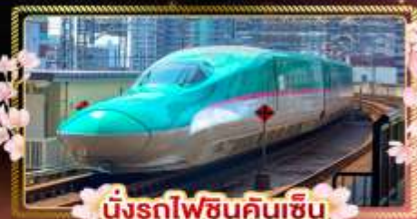
นั่งรถไฟชินคันเซ็น