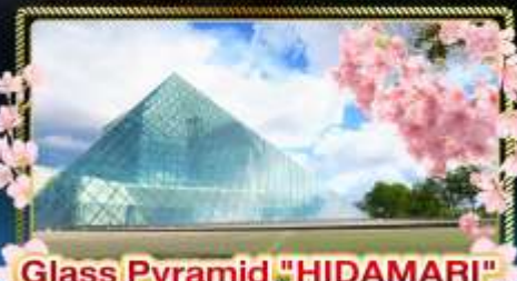
Glass Pyramid "HIDAMARI"