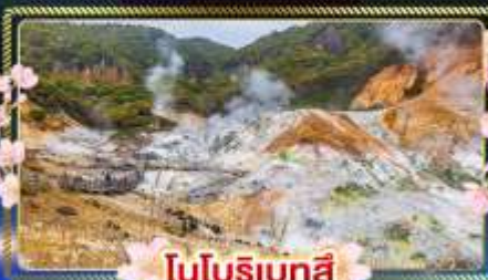
โนบุริเบตสึ

เที่ยวชมไฮไลท์ฮอกไกโดได้ ในช่วงที่สดชื่นที่สุดของปี