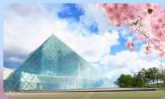
Glass Pyramid "HIDAMARI"