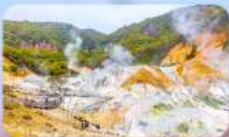
โอบิโรบะทสึ