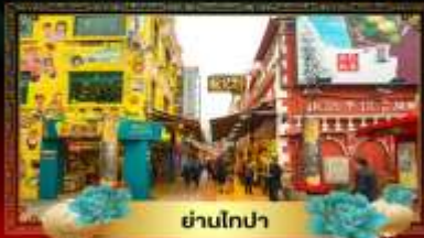
ย่านโกปา