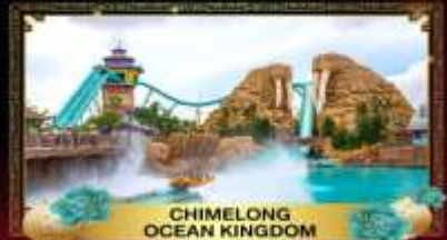
CHIMELONG OCEAN KINGDOM