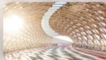
Atyrau Bridge Astana