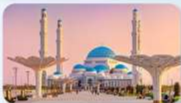
Astana Grand Mosque