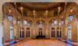
Palacio the Bolsa