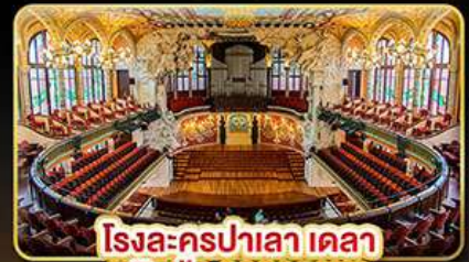
โรงละครปาเลา เดลา มูสิกา คาคาลานา