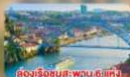
ล่องเรือชมสะพาน 6 แห่ง ในคูร์เมืองปอร์โต