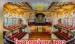
โรงละครปลาส เดลลา มูสิคกา คาตาลา