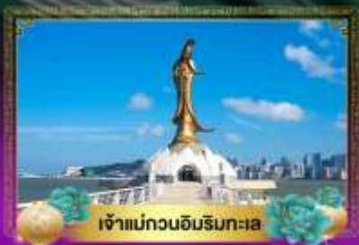
เจ้าแม่กวนอิมริมทะเล