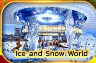
Ice and Snow World