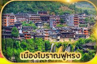
เมืองโบราณฟูหลง