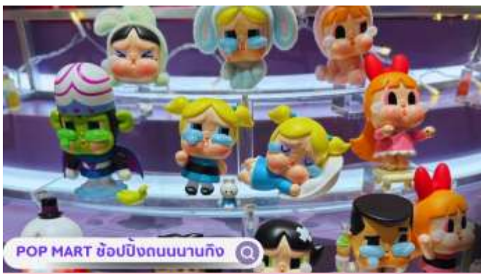
POP MART ช้อปบิงก้นนานกิง