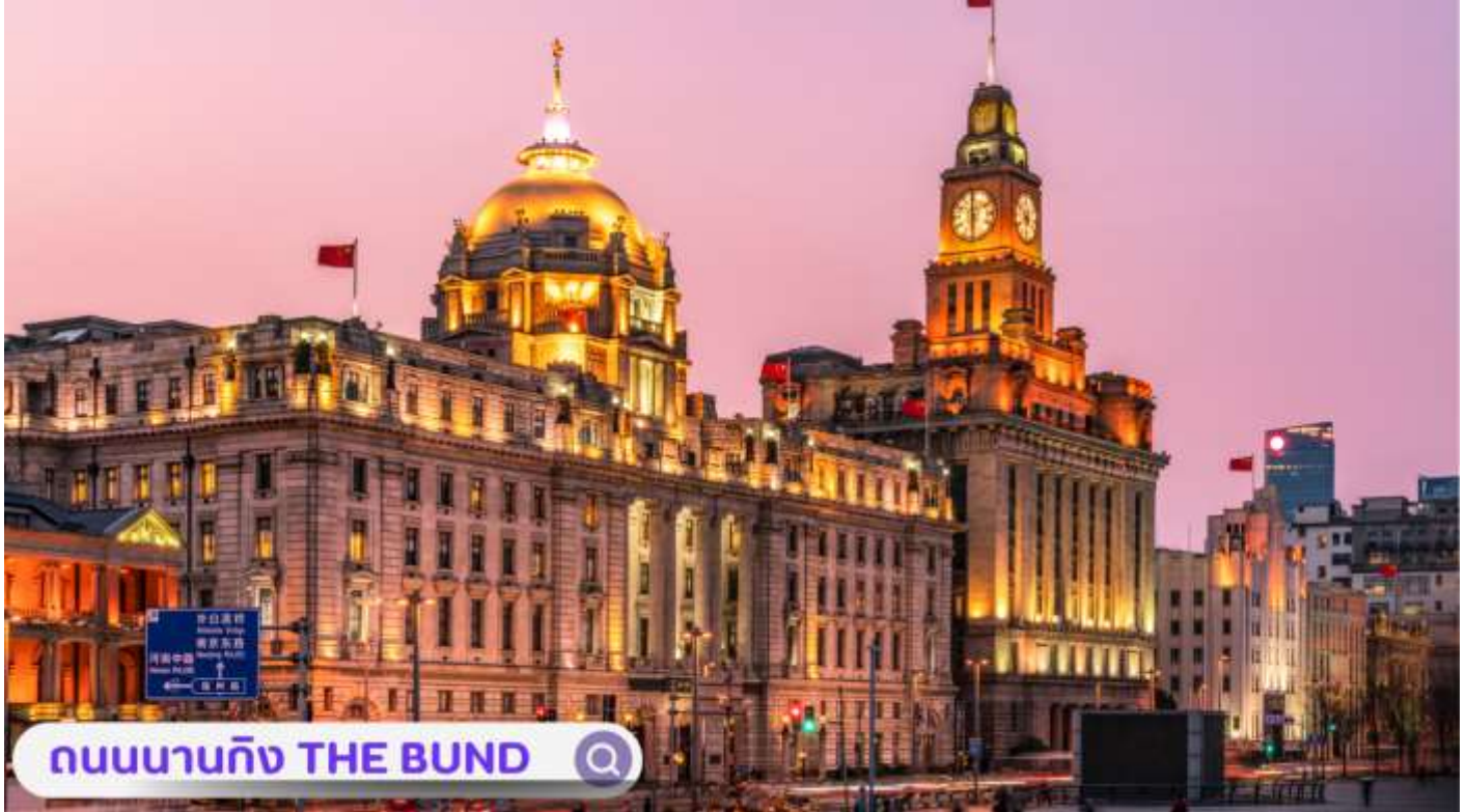
ถนนนานกิง THE BUND

จากนั้นอิสระท่านเพิลิตเพลินที่ ถนนนานกิง(NANJING ROAD) เป็นย่านช้อปปิ้งเก่าแก่ที่สุดของเซี่ยงไฮ้ เป็นตลาดซื้อขายของกันคึกคักตั้งแต่ทศวรรษ 1920 ตั้งอยู่ฝั่งผู้ซีกินพื้นที่ยาวตั้งแต่ฝั่งตะวันตกของ “เดอะ บันด์” ถึง “พีเพิลส์ สแควร์” เป็นแหล่งช้อปปิ้งสินค้าแบรนด์เนมจากทั่วโลก และยังเป็นศูนย์รวมร้านค้าและร้านอาหารอีกมากมาย และพลาดไม่ได้กับนักจุ่มอาร์ทออยอย่าง แกรนด์ POPMART GLOBAL FLAGSHIP STORE ร้านขายของเล่นที่เป็นที่โด่งดังในขณะนี้ไม่ว่าจะ LABUBU MOLLY SKULLPANDA และอย่างอื่นอีกมากมาย ให้ท่านได้เลือกลุ้นกันอย่างสนุกสนาน