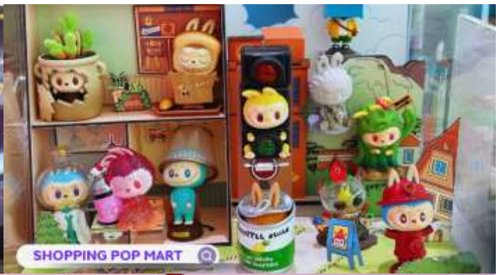
SHOPPING POP MART