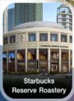
Starbucks Reserve Roastery

เทศกาล สงกรานต์ คอนเฟิร์มออกเดินทาง ทุกพีเรียด 2 ท่านขึ้นไป