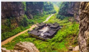
อุทยานหลุมฟ้าสะพานสวรรค์