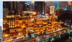
หงหยาดัง(ตอนกลางคืน)

*ทางบริษัทฯ ขอสงวนสิทธิ์ในการสลับโปรแกรมทัวร์ตามความเหมาะสมขึ้นอยู่กับสถานการณ์หน้างาน โดยคำนึงถึงผลประโยชน์ของลูกค้าเป็นสำคัญ