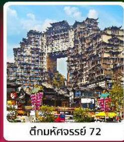
ตึกหัตถกรรม 72

• ไอลาร์ เก็บหมดครบสี่เมือง จางเจียเจีย อุหลง ดงซิ่ง ฝูหลงจิน อุทยานหลุมบ่อฟ้า รถไฟฟ้าเกะลุตึก ตึกหัตถกรรม 72