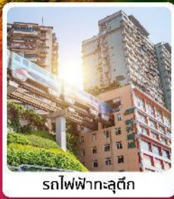
รถไฟฟ้าเกะลุตึก