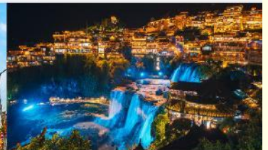
หมู่บ้านโบราณฟูหลงเจิน

*ทางบริษัทฯ ขอสงวนสิทธิ์ในการสลับโปรแกรมทัวร์ตามความเหมาะสมขึ้นอยู่กับสถานการณ์หน้างาน โดยคำนึงถึงผลประโยชน์ของลูกค้าเป็นสำคัญ