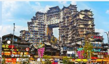
ตีทมห้ศจวสรร์ย 72