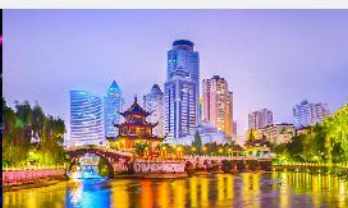
หอเจี่ยเซียวไหลว