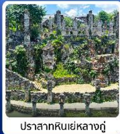
ปราสาทหินเย่หลางกู่