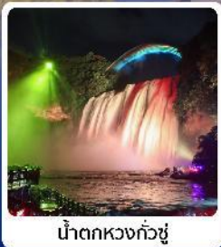
น้ำตกหวงกั๋วซู่