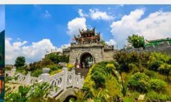
เมืองโบราณซิงเหยียน

*ทางบริษัทฯ ขอสงวนสิทธิ์ในการสลับโปรแกรมทัวร์ตามความเหมาะสมขึ้นอยู่กับสถานการณ์หน้างาน โดยคำนึงถึงผลประโยชน์ของลูกค้าเป็นสำคัญ