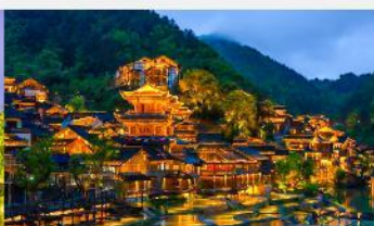
หมู่บ้านโบราณฉูเจียงจ้าย