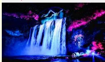
อุทยานน้ำตกหวงกั๋วชู่