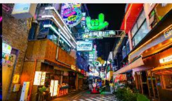
ถนนคนเดินซิงหยุน