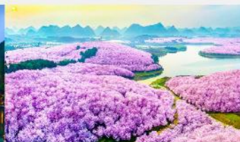
ชากรุง-ผิงป่า

*ทางบริษัทฯ ขอสงวนสิทธิ์ในการสลับโปรแกรมทัวร์ตามความเหมาะสมขึ้นอยู่กับสถานการณ์หน้างาน โดยคำนึงถึงผลประโยชน์ของลูกค้าเป็นสำคัญ