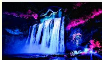
อุทยานน้ำตกหวงกั๋วซู่