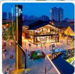
ถนนคนเดินไท่กุหลี่