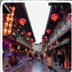
ถนนโบราณจีนหลี