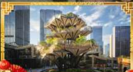
XIAN TREE&MIXC MALL