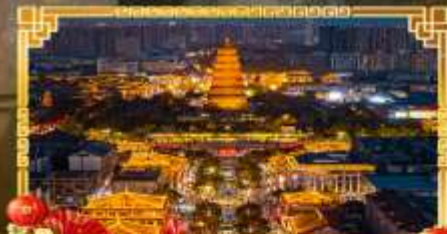
ถนนคนเดินราชวงศ์ถัง