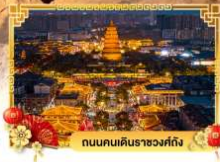
ถนนคนเดินราชวงศ์ถัง

เดินทางโดย: สายการบินสปริงส์แอร์ไลน์ (9C)