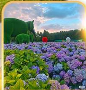
ดอกไม้ตามฤดูกาล