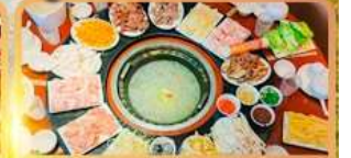
สุกี้เห็ด