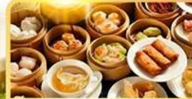
อาหารกวางตุ้ง