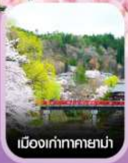
เมืองเก่าทาคายาม่า

เช็คอินโอซาก้า ชมชากุระภูเขาโยชิโนะ เมืองนารา เข้าชมหมู่บ้านชิราคาวาโกะ เดินเล่นเมืองเก่าทาคายาม่า ซุปปิ้งชินไซบาชิ เทียวเต็มไม่มีอิสระ