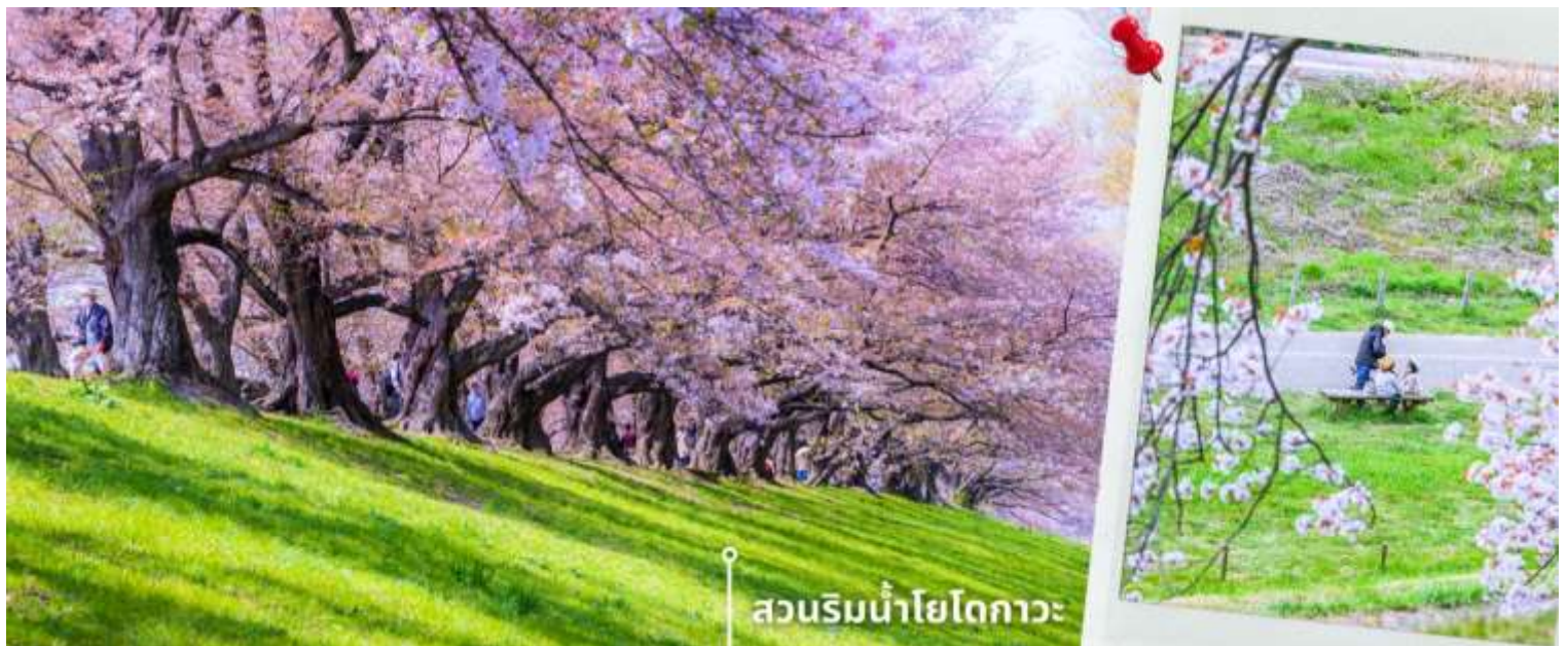
สวนริมน้ำโยโดกาว่า

นำท่านเดินทางชมดอกซากุระบานที่ สวนริมน้ำโยโดกาว่า เป็น สถานที่ชมดอกซากุระริมน้ำอีก1จุดยอดนิยมของเมือง ที่มีต้นซากุระมากถึง 250 ต้น เรียงกันอยู่2ข้างทาง ความยาวกว่า 1.4 กิโลเมตร ดูราวกับอุโมงค์สีชมพูที่สวยงาม