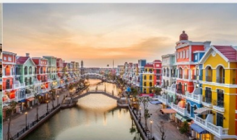
แกรนด์เวิลด์ฟู้ท๊วก