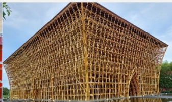
บ้านไม้ไฟ