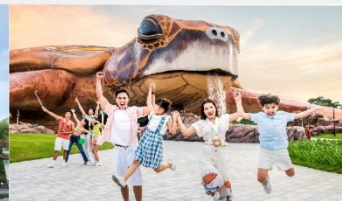
วินเพิร์ล อควาเรียม

*ทางบริษัทฯ ขอสงวนสิทธิ์ในการสลับโปรแกรมทัวร์ตามความเหมาะสมขึ้นอยู่กับสถานการณ์หน้างาน โดยคำนึงถึงผลประโยชน์ของลูกค้าเป็นสำคัญ