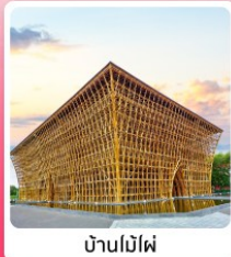
บ้านไม้ไผ่

ไอโวลท์ เทียวครบ สวนน้ำ Aquatopia & สวนสนุก Vin Wonder เวนิสแห่งเวียดนาม Grand World Phu Quoc แลนด์มาร์คสุดโรแมนติก