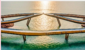
สะพานจูป