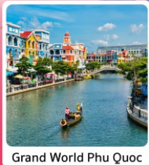
Grand World Phu Quoc