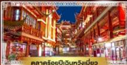
ตลาดร้อยปีเดินห้างเมี่ยว