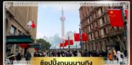
ช้อปปิ้งถนนนานกิง