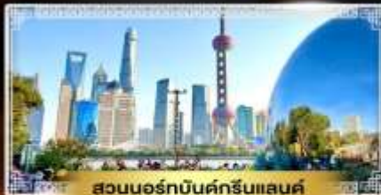
สวนนอร์มัลบิลด์กรีนแลนด์