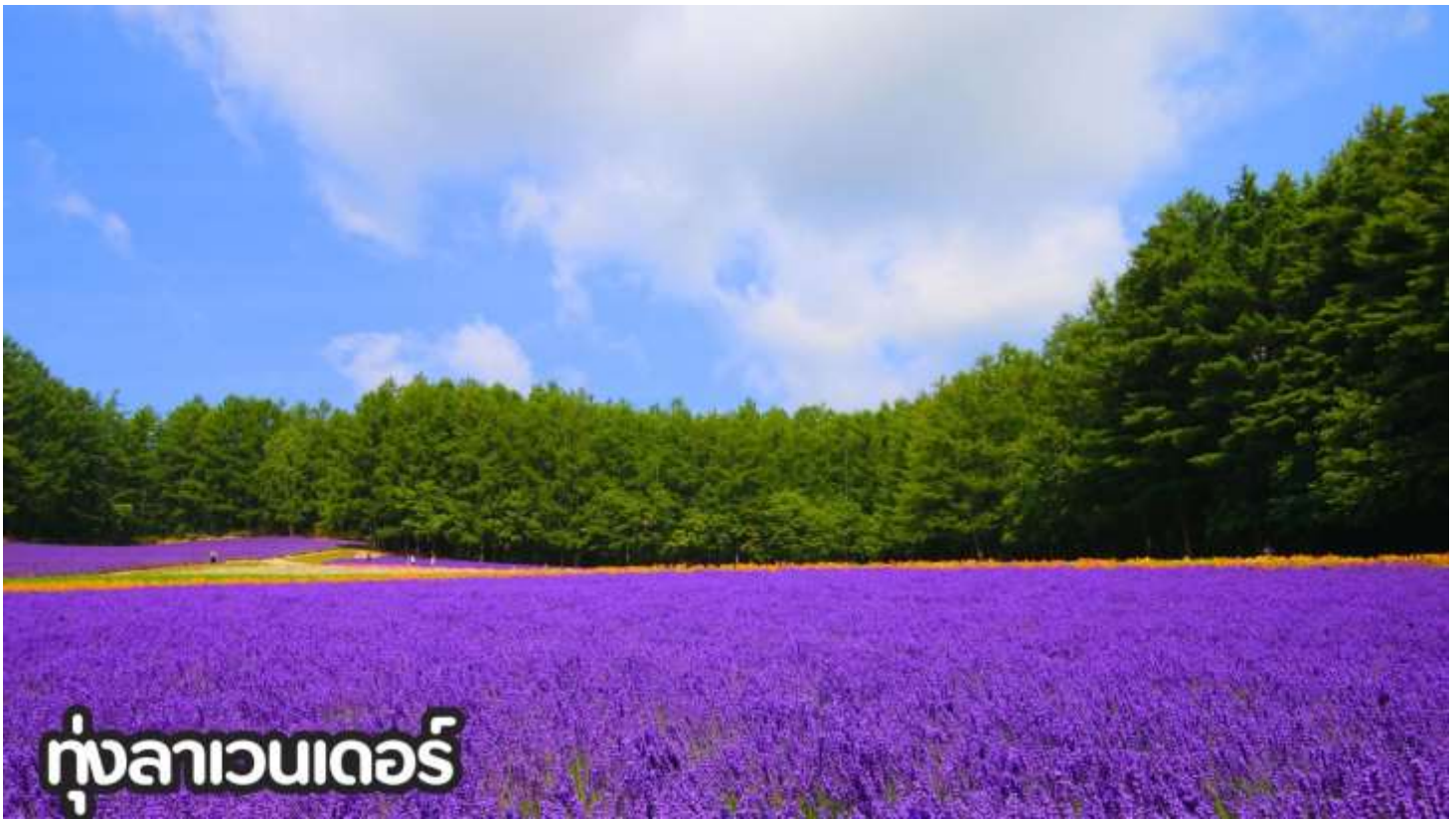
ทุ่งลาเวนเดอร์