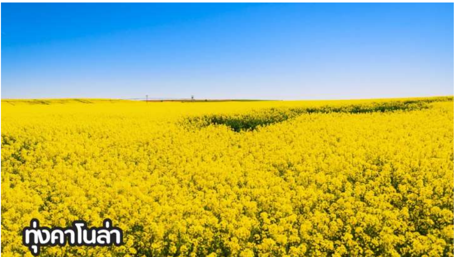
ทุ่งคาโนล่า

ที่พัก Holiday Inn Express หรือเทียบเท่าระดับ 4 ดาวจีน