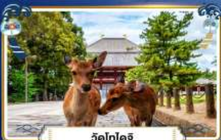
วัดโทไดจิ