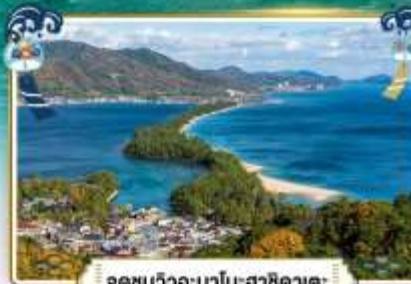
จุดชมวิวงอะมาโนฮาชิคาตะ