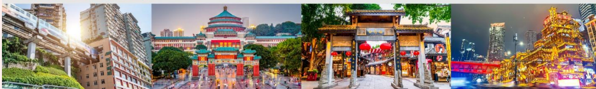
รถไฟฟ้าทะเลตึก