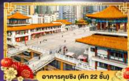
อาคารคุยซิง (ตึก 22 ชั้น)