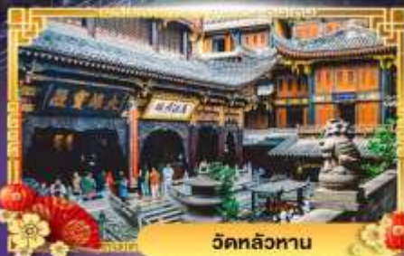
วัดหลัวหนาน