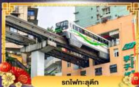
รถไฟฟ้า-ลู่ตัก