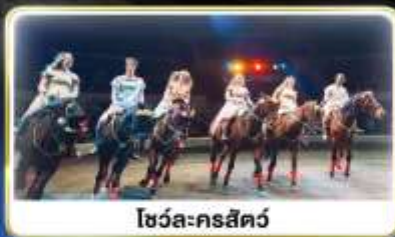
โชว์ละครสัตว์