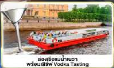
ล่องเรือแม่น้ำวอวา พร้อมเสิร์ฟ Vodka Tasting