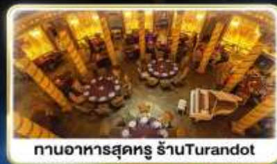
ทานอาหารสุดหรู ร้านTurandot