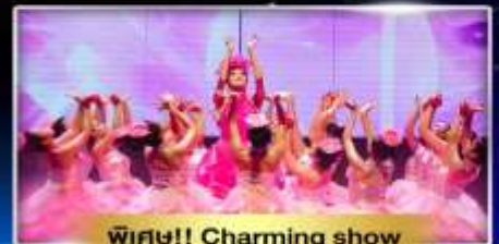
พิเศษ!! Charming show