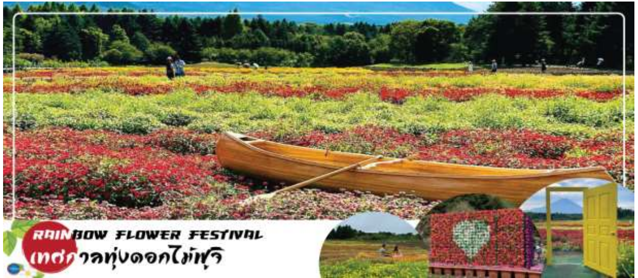
RAINBOW FLOWER FESTIVAL เทศกาลทุ่งดอกไม้ฟูจิ

หรือ เทศกาลชมดอกลาเวนเดอร์ที่ทะเลสาบคาวากูจิ Fuji Kawaguchiko Herb Festival (ซึ่งมีที่ผ่านมาเทศกาลอยู่ในช่วงวันที่ 21 มิถุนายน – 21 กรกฎาคม 2025) จัดขึ้นที่ริมทะเลสาบคาวากูจิในช่วงต้นฤดูร้อน ซึ่งนอกจากจะจัดขึ้นเพื่อต้อนรับฤดูชมดอกลาเวนเดอร์แล้ว ยังจะได้เพลิดเพลินไปกับความงามของดอกไม้หลากชนิด เช่น ดอกคาโมมายล์และสมุนไพรมากมาย โดยสถานที่จัดงานหลักคือ สวนสาธารณะยากิซาคิ (Yagizaki Park) สวนยอดนิยมที่ดึงดูดนักท่องเที่ยวมากมายด้วยลาเวนเดอร์ชอฟคริมและชาสมุนไพร์ และสวนสาธารณะโออิชิ (Oishi Park) ที่มีภาพภูเขาฟูจิซึ่งเป็นฉากหลังของทะเลสาบคาวากูจิตัดกันกับภาพทุ่งดอกลาเวนเดอร์อย่างสวยงาม อิสระให้ท่านได้วิ่งเล่นท่ามกลางทุ่งดอกลาเวนเดอร์สีม่วงสดใส สัมผัสกลิ่นหอมสดชื่น และเพลิดเพลินกับทิวทัศน์อันงดงาม พร้อมเก็บภาพความประทับใจตามอัธยาศัย (ดอกลาเวนเดอร์จะบานหรือไม่นั้น ทั้งนี้ขึ้นอยู่กับสภาพอากาศ สงวนสิทธิ์หากช่วงวันเดินทางลาเวนเดอร์ไม่มาแล้ว ก็ยังสามารถปรับโปรแกรมได้โดยไม่ต้องแจ้งล่วงหน้า)