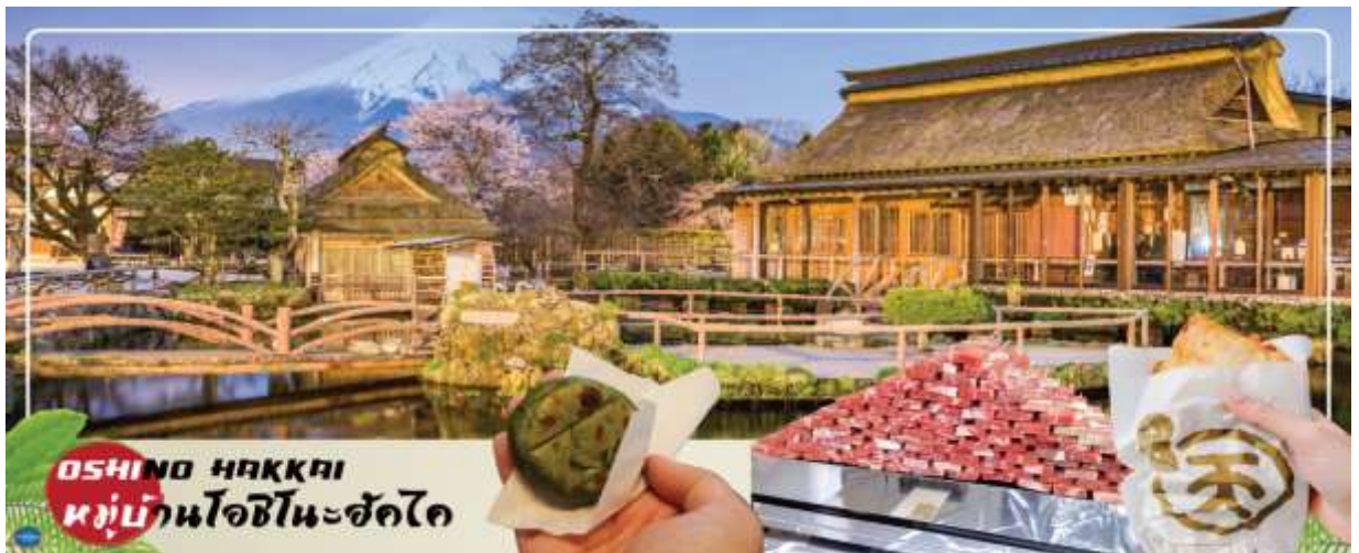
OSHINO HAKKAI หมู่บ้านโอชิโนะฮัคไค

หรือ เทศกาลชมดอกลาเวนเดอร์ที่ทะเลสาบคาวากูจิ Fuji Kawaguchiko Herb Festival (ซึ่งมีที่ผ่านมาเทศกาลอยู่ในช่วงวันที่ 21 มิถุนายน – 21 กรกฎาคม 2025) จัดขึ้นที่ริมทะเลสาบคาวากูจิในช่วงต้นฤดูร้อน ซึ่งนอกจากจะจัดขึ้นเพื่อต้อนรับฤดูชมดอกลาเวนเดอร์แล้ว ยังจะได้เพลิดเพลินไปกับความงามของดอกไม้หลากชนิด เช่น ดอกคาโมมายล์และสมุนไพรมากมาย โดยสถานที่จัดงานหลักคือ สวนสาธารณะยากิซาคิ (Yagizaki Park) สวนยอดนิยมที่ดึงดูดนักท่องเที่ยวมากมายด้วยลาเวนเดอร์ชอฟคริมและชาสมุนไพร์ และสวนสาธารณะโออิชิ (Oishi Park) ที่มีภาพภูเขาฟูจิซึ่งเป็นฉากหลังของทะเลสาบคาวากูจิตัดกันกับภาพทุ่งดอกลาเวนเดอร์อย่างสวยงาม อิสระให้ท่านได้วิ่งเล่นท่ามกลางทุ่งดอกลาเวนเดอร์สีม่วงสดใส สัมผัสกลิ่นหอมสดชื่น และเพลิดเพลินกับทิวทัศน์อันงดงาม พร้อมเก็บภาพความประทับใจตามอัธยาศัย (ดอกลาเวนเดอร์จะบานหรือไม่นั้น ทั้งนี้ขึ้นอยู่กับสภาพอากาศ สงวนสิทธิ์หากช่วงวันเดินทางลาเวนเดอร์ไม่มาแล้ว ก็ยังสามารถปรับโปรแกรมได้โดยไม่ต้องแจ้งล่วงหน้า)