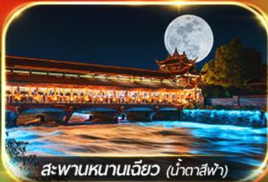
สะพานหนานเจียว (น้ำตาสีฟ้า)