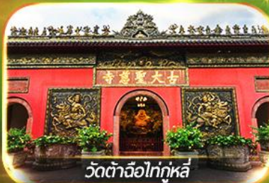
วัดต้าจื่อไท่กุหลี่