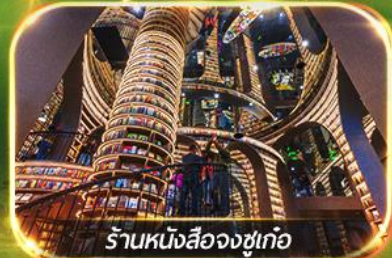
ร้านหนังสือจงซูเกอ

เที่ยวชมทัศนียภาพ 2 อุทยาน ปู้เฟิงโกว & ชวงเจียวโกว เชคอินแพนด้าเซลฟ์ & แพนด้าปิ่นตึก ซ้อปบั้งจู่ใจที่ถนนคนเดินซุนซีลู่