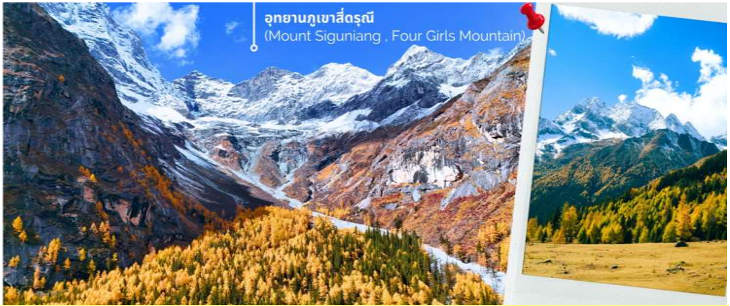
อุทยานภูเขาสี่ดรุณี (Mount Siguniang , Four Girls Mountain)

มัทรีมา ผสมผสานกับป่าไม้เขียวขจีราวกับดินแดนสวรรค์ ส่วนบริเวณใกล้เคียงยังเป็นที่ตั้งของหมู่บ้านชาวทิเบตที่มีวิถีชีวิตเรียบง่าย อีกจุดที่ควรค่าแก่การเข้าไปเยี่ยมชม สัมผัสวิถีแบบดั้งเดิมอย่างใกล้ชิด