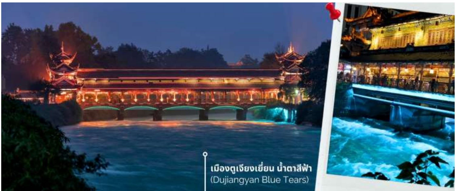
เมืองตูเจียงเยียน น้ำตาสีฟ้า (Dujiangyan Blue Tears)

นำท่านเดินทางสู่ เมืองโบราณตูเจียงเยียน เมืองนี้เป็นแหล่งโครงการชลประทานต้นแบบสมัยโบราณที่มีประวัติยาวนานมากกว่า 2,274 ปี ตั้งอยู่ในมณฑลเสฉวน เพื่อแก้ปัญหาน้ำท่วมในพื้นที่ลุ่มแม่น้ำ Minjiang และเพื่อจัดสรรน้ำสำหรับการเกษตรนี้ โดยการสร้างควบคุมน้ำที่ไม่ต้องพึ่งพาเขื่อนชลประทานนี้ยังคงใช้งานได้ดีจนถึงปัจจุบันและได้รับการยกย่องให้เป็นหนึ่งในมรดกโลกโดยองค์การยูเนสโก และยังเป็นต้นแบบของภูมิปัญญาด้านการจัดการทรัพยากรน้ำของจีน ไม่เพียงแต่ได้รับการ ยกย่องในด้านวิศวกรรมอันชาญฉลาดและประโยชน์ต่อระบบนิเวศเท่านั้นแต่ยังเป็นที่ยู่อักในฐานะสถานที่ชมความงามของปรากฏการณ์ “น้ำตาสีฟ้า” ที่ตราตรึงใจนักท่องเที่ยวทั่วโลก ให้ท่านเข้าชม ธารน้ำสีฟ้า Blue Tears เป็นจุดท่องเที่ยวที่เต็มไปด้วยมนต์เสน่ห์แห่งสถาปัตยกรรมจีนแบบดั้งเดิม ทอดยาวข้ามแม่น้ำ กลายเป็นภาพอันน่าประทับใจยามค่ำคืนเมื่อแสงไฟตกแต่งส่องสะท้อนน้ำให้กลายเป็นสีฟ้าเงิน ดูสวยงามราวกับโลกแห่งจินตนาการ ความพิเศษอยู่ที่การจัดไฟอย่างประณีต ซึ่งช่วยเน้นให้สะพานมีชีวิตชีวาท่ามกลางบรรยากาศยามค่ำคืนที่รายรอบไปด้วยภูเขาและต้นไม้เพิ่มความรู้สึกสงบและสดชื่น เมื่อเดินข้ามสะพานนี้แล้วได้สัมผัสกับบรรยากาศรอบๆ มีแสงไฟที่ส่องประกายลงสู่ผืนน้ำจึงเป็นประสบการณ์ที่ทำให้รู้สึกผ่อนคลายและเต็มไปด้วยความประทับใจที่ยากจะลืม